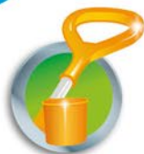
BARRA DE ARRASTRE CON PORTA MAMADERA