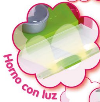
Horno con luz