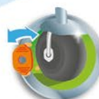
EMBRAGUE PARA DESCANSO