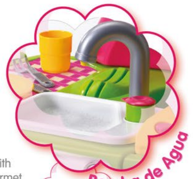
Bomba de Agua