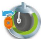
EMBRAGUE PARA DESCANSO